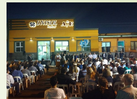
Centro Unisol Dos de Mayo Provincia de Misiones

Atención en consultorios de diversas especialidades médicas. Servicio de odontología e internación.