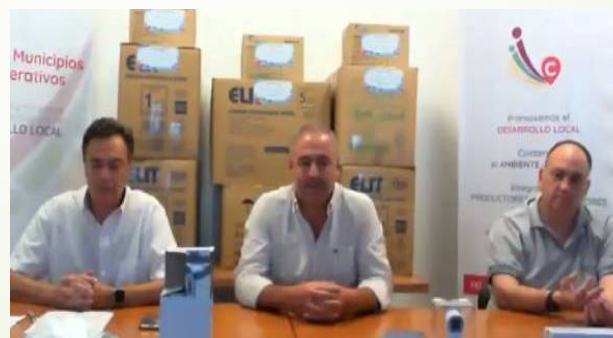
Entrega de insumos a la Red de Municipios Cooperativos de COOPERAR