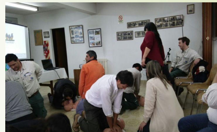
Curso en Cooperativa de FEDECOPA

En nuestro país existen 2 leyes en relación a este tema: la Ley de la Ciudad de Buenos Aires Nº 4.077 que exige que “todos los lugares de concurrencia de público tengan capacitado a su personal en reanimación cardiopulmonar y cuenten con desfibriladores externos automáticos”; y la Ley Nacional Nº 27.159 que exige la instalación de desfibriladores automáticos en espacios públicos y en aquellos lugares cerrados donde se concentren o circulen por día mil personas o más.