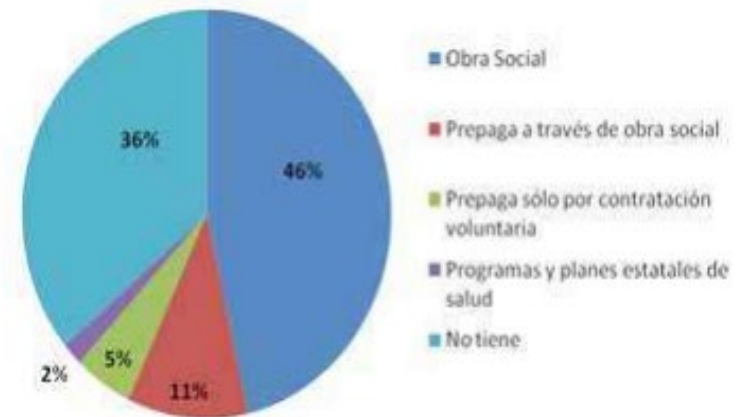
Figura 9.3. Población según tipo de cobertura de salud. República Argentina. Año 2010.