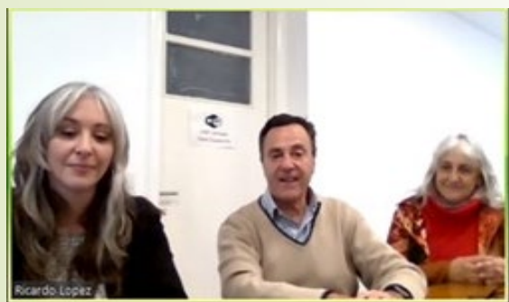
Donación de insumos a la Cooperativa Ibarlucea Ltda.