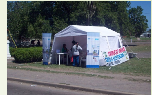
Cooperativa Mariano Acosta Ltda