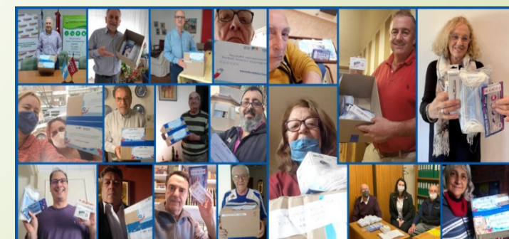
Provisión de insumos a la Mutual Unisol Salud