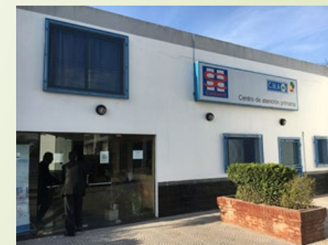
Centro Unisol Mariano Acosta Provincia de Buenos Aires