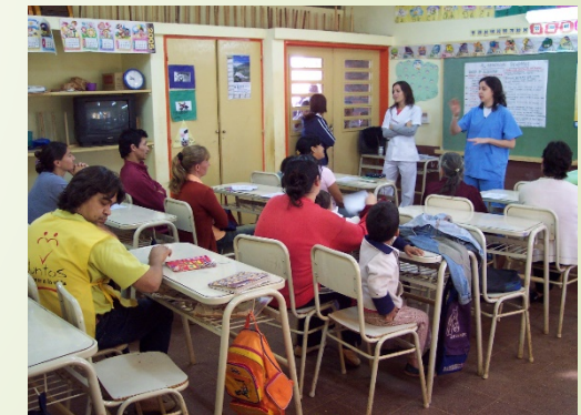
Campaña FRC y Nutrición Centro Unisol Salud Dos de Mayo, Misiones