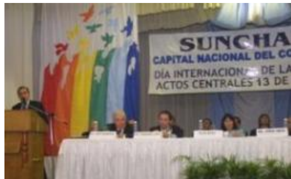
Actos Centrales, Sunchales

Cabe destacar que los representantes de la ACI fueron recibidos por el Consejo de Administración de Sancor Cooperativa de Seguros Limitada, quienes manifestaron su agradecimiento por la aceptación de la membresía en la Alianza Cooperativa Internacional.