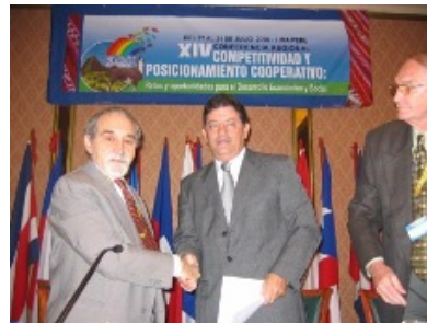
Firma Convenio entre representantes de ACI-Américas y CRE

Específicamente, las colaboraciones entre CRE y la ACI-América se fundamentarán en el desarrollo y la innovación del movimiento cooperativo de Bolivia; en la investigación y el desarrollo de metodologías, herramientas, procesos y praxis que contribuyan a la excelencia de las empresas cooperativas, a la membresía y a la propia organización; y en la colaboración profesional, en el diseño, planificación, desarrollo y evaluación de proyectos de desarrollo de la cultura y experiencias cooperativas y de Economía Social.