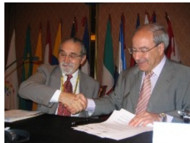
Firma Convenio entre los representantes de ACI-Américas y Corporación Mondragón

El convenio con la Cooperativa Rural de Electrificación (CRE) se enmarca dentro de los objetivos fundamentales de IPlan Estratégico de la ACI-Américas : promover actividades de apoyo a la formación, capacitación, investigación y asistencia técnica para sus entidades miembros y el cooperativismo del continente americano. Por su parte, CRE tiene interés en dar a sus asociados y cooperativistas Bolivianos los servicios y actividades promovidos por la ACI-Américas.